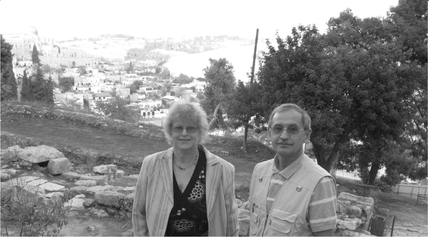
algus lk. 2

reisi ajal meie giid rõhutas – mitte koht, vaid sõnum on oluline. Suures hauakirikuski on kaks erinevat kohta, mida Jeesuse hauaks peetakse.