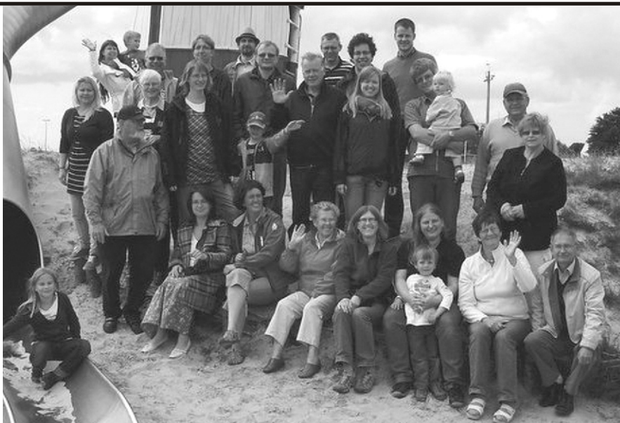
Võõrustajatega Multimar Wattforumi mänguväljakul

Järgmised kolm päeva olime külas Breklumi koguduse pasunakoorigi. Külastasime Nordstrandischmoori saart, mis kuulub Friisi saarestikku. Saarestik tekkis 10.-14. sajandil, kui meri tungis korduvalt düünidest (kaldaseljandik) läbi ja uhtus nende taga oleva turbapinnasest maa ära. Saari eraldab mandrist Waddensee (mudameri). Saarele sõitsime kaevurite rongi tüüpi sõiduriistaga mööda mere põhja ehitatud kitsarööplise raudteed, mis tõusu ajal kattub veega. Saarel elab kakskümmend elanikku, neist neli last,