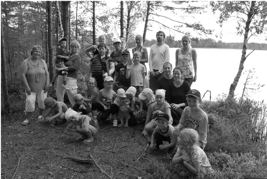
Matkajad Kõnnu järve ääres

ilmselgelt parimaks meelelahutuseks kõõlumine päris ehtsal traktoril ja sõitmine mitmeid põlvkondi teeninud mänguautoga, kuhu sai sisse istuda ja rooli keerata.