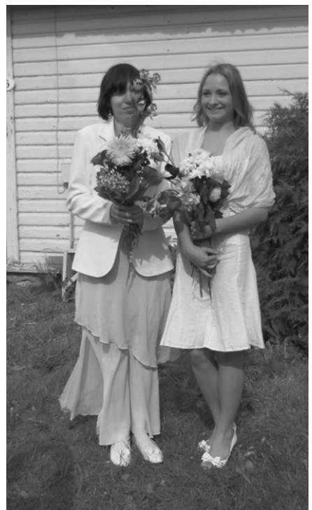
Leerilapsed Sakus 2012

õdedele ja oleme tänulikud armastuse ja eestpalvete eest, mida vanema vennana Saku koguduse vastu üles näitate! Tööd on palju, aga Issand on ustav! Meie usk on, et saame näha Sakus kirikut ja veelgi enam, elavat kogudust, mis kuulutab Kristuse evangeeliumit, teenides sõna ja teoga Jumalat ning inimesi, juhtides otsijaid elavasse suhtesse Jumalaga!