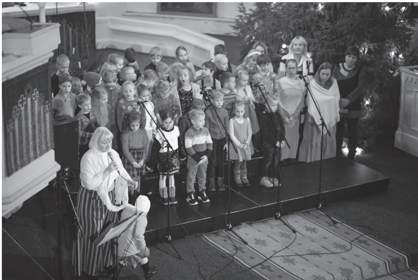
15. detsembri õhtul kogunes Hageri kirikusse jõulukogudus - Kohila Männi lasteaia pere tuli jõule tähistama. Kuulati lugu kahest kirikukellast ning lapsed laulsid koos vanematega. Teiste seas musitseerisid ja panustasid kontserdi korraldamisse mitmed Hageri koguduse liikmed, kelle lapsed käivad Männi lasteaias.

Kammerkoor on küll täiesti ära hellitatud, kuna meie armas dirigent Merle on meile oma kodus enne lauluproovi lausa sooja suppi koos sinna juurde kuuluva hea ja paremaga pakkunud. Hõrkudest kookidest ja soojast taimeteest rääkimata. Kui taas kogudusemajja saame, siis tahame ka! 😊