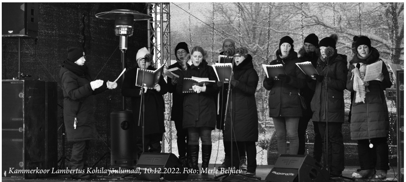
Kammerkoor Lambertus Kohila jõulumaal, 10.12.2022.

Nõnda siis kutsub Jeesus tegema head ja andeks andma ligimesele tema eksimused. Kui meiegi päevast päeva oma eksimused taevaselt kuningalt andeks palume ja andeks saame, siis on ka meie kohus oma kaaslastele tema võlad andeks anda ja kustutada. Me ei taha ju keegi sattuda samasse piinapaika, kuhu sattus too tige sulane, kes oma võlad oli andeks saanud, kuid kaassulasele ei andestanud.