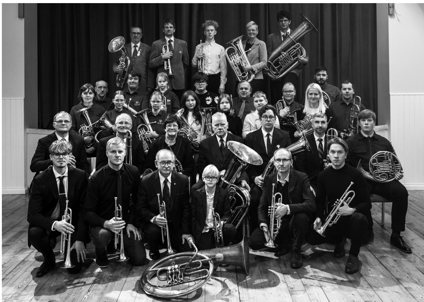
Hageri pasunakoor 75. Hageri rahvamajas koos külalistega Kohilast, Raplast ja Koselt 6.11.2022.

Pidulik osa rahvamajas oli kui misjonisündmus. Rõõmustav oli kuulda ja kogeda, et kõik, kes Hageri pasunakoori tervitasid, tegid seda kristlikus vaimus ja mängijatele õnnis-