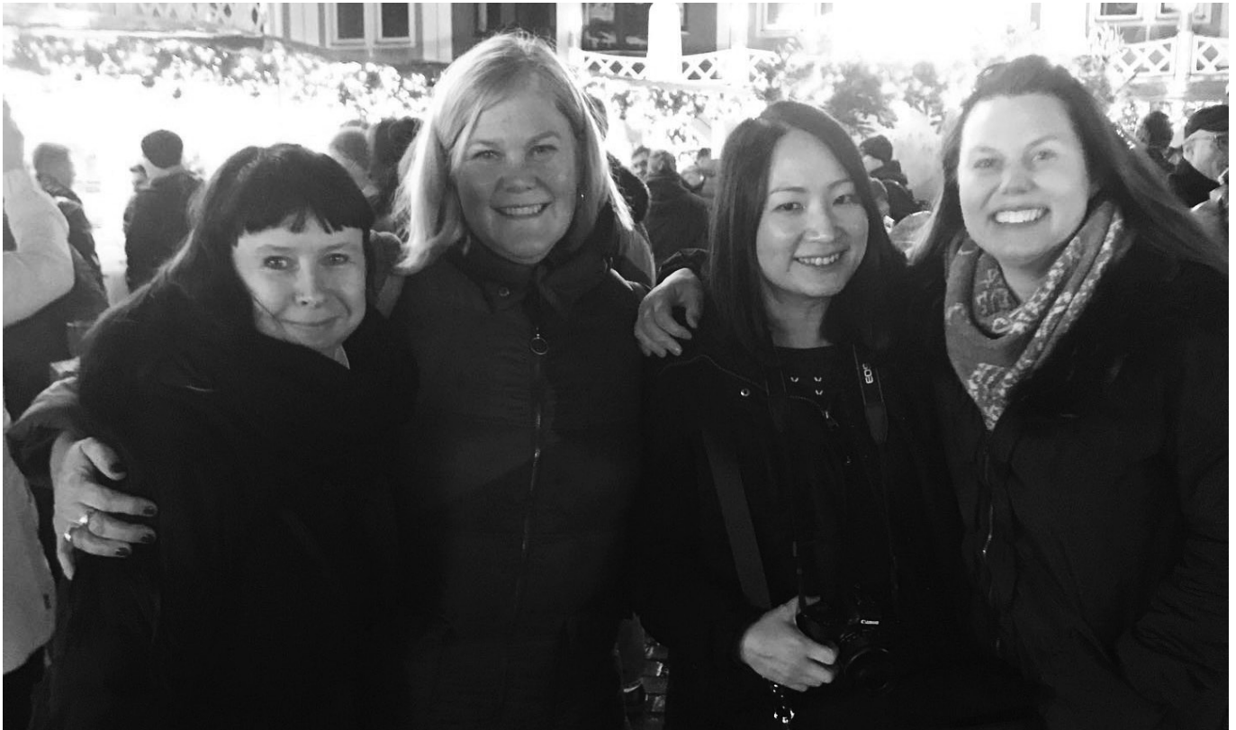
Üks osa Luterliku Maailmaliidu lauluraamatu komisjoni liikmetest Eestist, Rootsist, Malaisiast ja Saksamaalt Leipzgis, november 2022.

sellises segameeskonnas, kus osalejad Itaaliast, Saksamaalt, Inglismaalt, Belgiast, Serbiast ja Eestist, õpetab kannatlikkust. Kohati ka sellist „las minna“ mentaliteeti, mis pole mulle üldse omane, aga mida rohkem ma seda rakendan, seda rahulikum on enda elu – ei mõtle, ega muretse üle. Olen kindel, et kõik saab tehtud!