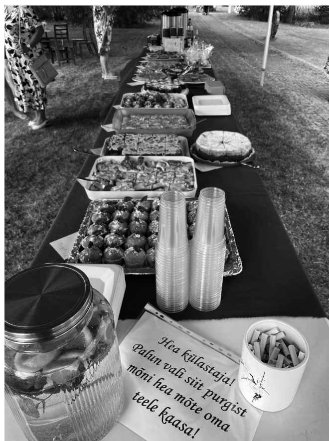
Hageri kirikuaia kohvik, 20.08.2022.

Ei jäänud muud üle, kui leida teine lahendus. See lahendus on üsna vana - teeme proove kodudes. Mäletan oma