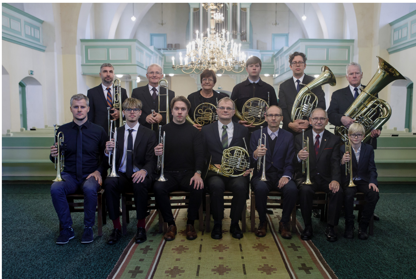
Hageri koguduse pasunakoos Hageri kirikus, 6.11.2022.